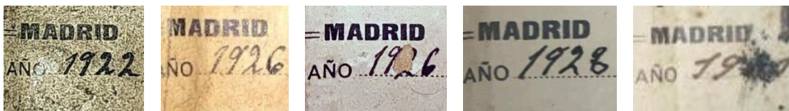
Etiqueta de la guitarra certificada y otras etiquetas de guitarras fechadas en 1926, 1928 y 1931.

Se trata de una guitarra española con etiqueta del constructor nacido en Cuenca Domingo Esteso López (1898-1937), y firmada en 1922. La etiqueta presenta rasgos originales de esta época del constructor, pese a su deficiente estado de conservación. La fecha está completada con tinta a pluma de forma autógrafa por el guitarrero y se corresponde caligráficamente con los ejemplos estudiados de la época.