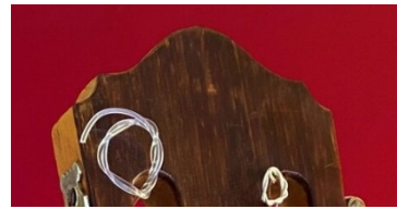
Recortes de pala de la guitarra certificada y de otras fechadas en 1928, 1926, 1926 y 1926.

Esta guitarra ha sido revisada a partir de vídeos y fotografías de buena calidad. No hay ningún elemento que me haga pensar que el instrumento no es original en su integridad y así lo firmo en Granada a 14 de julio de 2022.